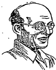
विनायक दामोदर सावरकर

के अतिरिक्त सावरकर ने जन्मजात बौद्धिक प्रतिभा का भी परिचय दिया है। गत चालीस वर्ष हुए उन्होंने मराठी में लिखना आरम्भ किया था। उनके लेखों के